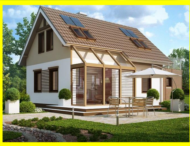
Населення (власники приватних дворів)