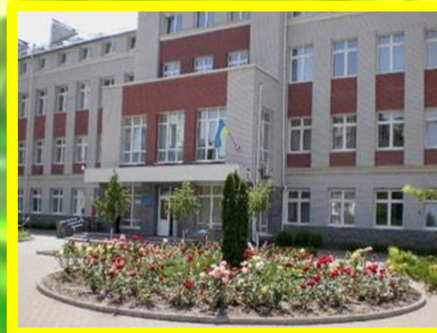
Державні замовлення (бюджетні організації, школи, лікарні, міські ради)

Наявність різноманітності цільової аудиторії сприяє: швидкому фінансовому зростанню фірми, зменшує ризики банкрутства при фінансових кризах та дозволяє розробляти гнучкі системи співпраці із конкретно взятою цільовою аудиторією.