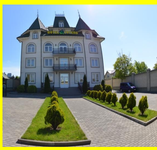
Комерційні замовлення (фірми, ресторани, готелі)